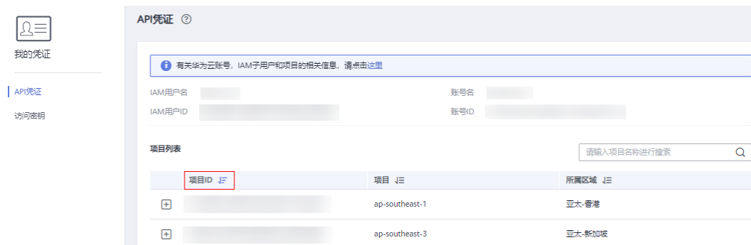
图 5-1 查看项目 ID