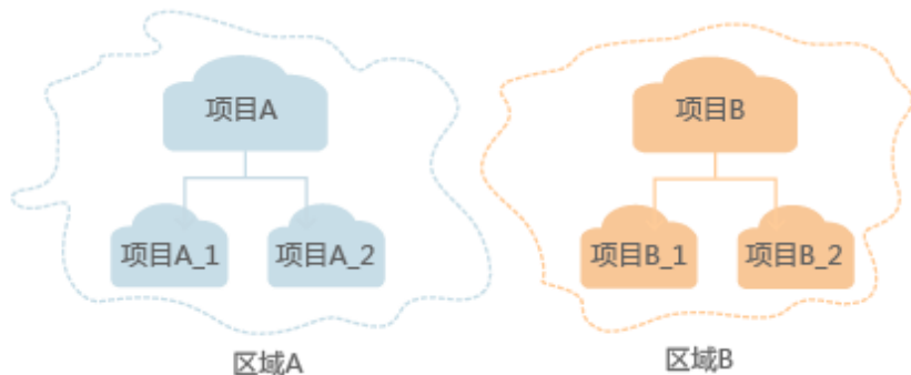
图 1-1 项目隔离模型